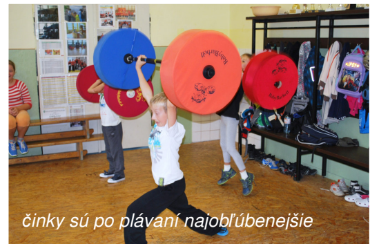
činky sú po plávaní najobľúbenejšie

Počasiu veru nebolo prázdninujúcim deťom na športovej škole príliš naklonené. V posilňovni sa zvládali základné cviky Projektu Zdravá chrbtica. Popoludní však vykuklo slniečko, a tak sa mohla uskutočniť aj ďalšia atletická súťaž . Pretekalo sa v hodoch medicinbalom a skokoch do diaľky. Relaxačnú prestávku vyplnilo riešenie vybraných príkladov z matematickej olympiády pre 2. a 3. ročník základných škôl.