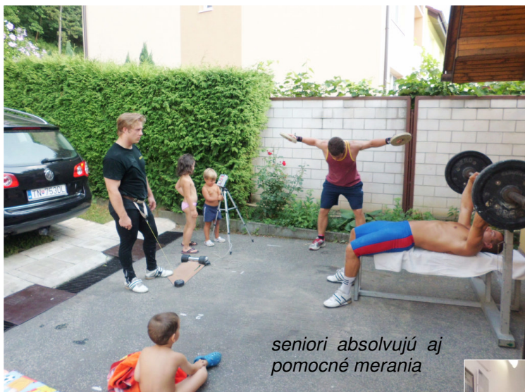
seniori absolvujú aj pomocné merania

Svoj vlastný tréning si dokáže riadiť snáď iba športovec, ktorý má danú problematiku dôkladne nastudovanú, za sebou desaťročia praxe, a samozrejme, ani to ešte nemusí byť zárukou úspechu. Športovcom, ktorí sa zaujímajú o vážny tréning, môže byť nápomocná literatúra objasňujúca ani nie tak konkrétne tréningové postupy, ako skôr mechanizmy, z ktorých vychádzajú. Aj keď, povedzme si pravdu, asi to budú práve tie konkrétne postupy, po ktorých športovec siahne ako prvých. A preto, netrápte sa, a ak hodláte obetovať svoj čas špecializovanému tréningu podľa papiera získaného z internetu a bez trénera, bude pre vás omnoho efektívnejšie započat' niektorý z variantov rekreačného športovania. V oblasti športovania pre zdravie a dobrý pocit sa aspoň nevystavujete riziku spôsobenia si trvalých poškodení.