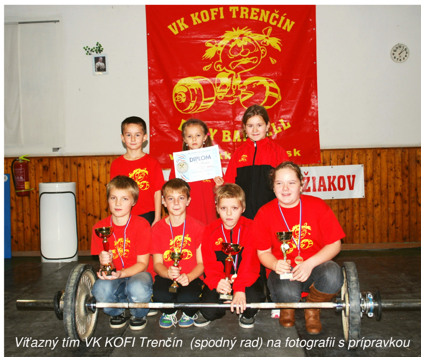
Víťazný tím VK KOFI Trenčín (spodný rad) na fotografii s prípravkou