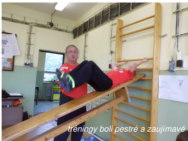
tréningy boli pestré a zaujímavé

Športové súťaže odštartovali dianie aj v pondelok. V atletike boli zaznamenané viaceré zlepšenia, v skoku z miesta a v hode medicinbalom.