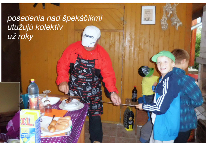
posedenia nad špekáčikmi utužujú kolektív už roky