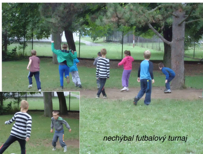
nechýbal futbalový turnaj