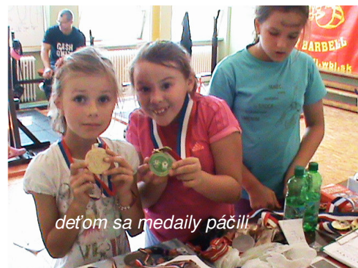
deťom sa medaily páčili

Prednáškovú časť po dobrom jedle netradične vystriedal hádankársky kvíz . Trénerka Zuzana si pre deti pripravila obľúbené detské hádanky, a tréner siahol po zábavnej forme riešenia príkladov z matematickej olympiády pre 1. a 2. ročník: „ Bolí tam šikvné hlavičky a vôbec ich to nenudilo, “ tréner ocenil fantastický prístup detí. vyhodnotenie.