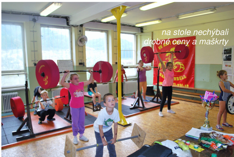
na stole nechýbali drobné ceny a maškrty

Zaujímavé boli výsledky futbalového turnaja medzi dievčatami a chlapcami : „v riadnom čase bol výsledok nerozhodný 6 ku 6, na jedenástky vyhrali chlapci 5 ku 2. Na záver boli súťaže vyhodnotené a víťazi odmenení.“ oznámil tréner.