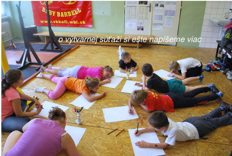
o výtvarnej súťaži si ešte napíšeme viac

pokračovanie – Prázdninová športová škola