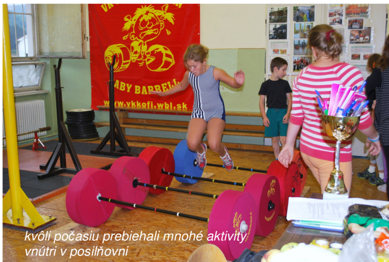
kvôli počasiu prebiehali mnohé aktivity vnútri v posilňovni