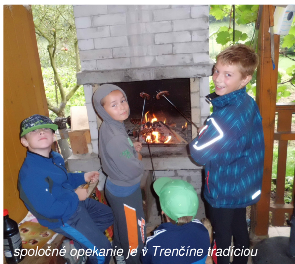
spoločné opekanie je v Trenčíne tradíciou

Popoludnie už bolo venované spoločnému posedeniu na záhrade , s vyhodnotením výsledkov nielen dnešného dňa, ale aj rozhovorom o dianí na prázdninovej škole, kde sa preberali dojmy z ostatného športového týždňa, ale vítané boli aj návrhy detí na aktivity v budúcom roku. „Po odpoľudňajšom odpočinku sme sa presunuli ku krbu, kde sme si opekali špekáčiky a veľmi chutili, okrem toho sme odovzdali deťom ceny za víťazstvá v súťažiach a Certifikát účastníka,“ hodnotil deň vedúci tréner.