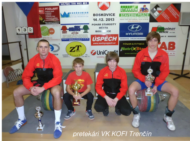
pretekári VK KOFI Trenčín

V poradí piatich družstiev si víťazstvo pripísali domáci, ktorých nasledoval Trenčín s rozdielom menej ako 10 bodov.