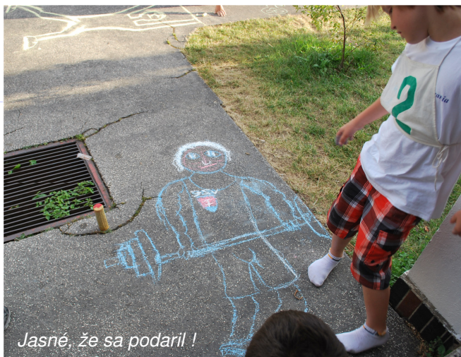
Jasné, že sa podaril !

pokračovanie – Letná škola vzpierania 2012 (5. nahliadnutie)