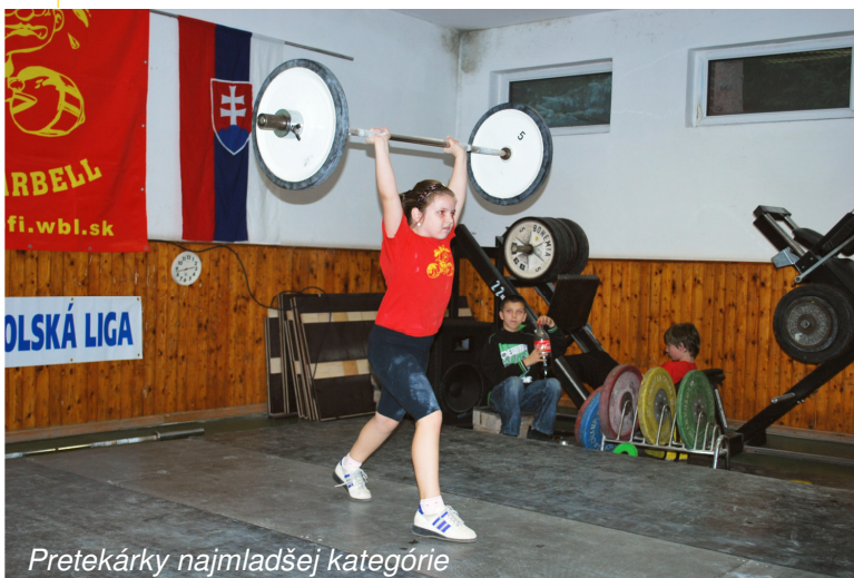
Pretekárky najmladšej kategórie