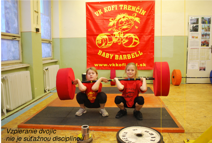
Vzpieranie dvojíc nie je súťažnou disciplínou

Tretie kolo školskej ligy v štvorboji prípravky 2012/2013 bolo záverečným v kalendárnom roku 2012, nasledujúce sa uskutočnia až v novom roku. V Trenčíne na Základnej škole Kubranská cesta sa 12. decembra stretli družstvá krúžku Baby Barbell z Trenčína (KOFI) a krúžku Zdravá chrbtica Centra voľného času Nové Mesto nad Váhom (PNM).