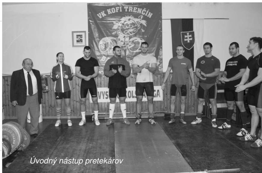
Úvodný nástup pretekárov

1. KOLO VYSOKOŠKOLSKÁ LIGA VO VZPIERANÍ, AKAD. ROK 2012/2013, 24. NOVEMBER 2012