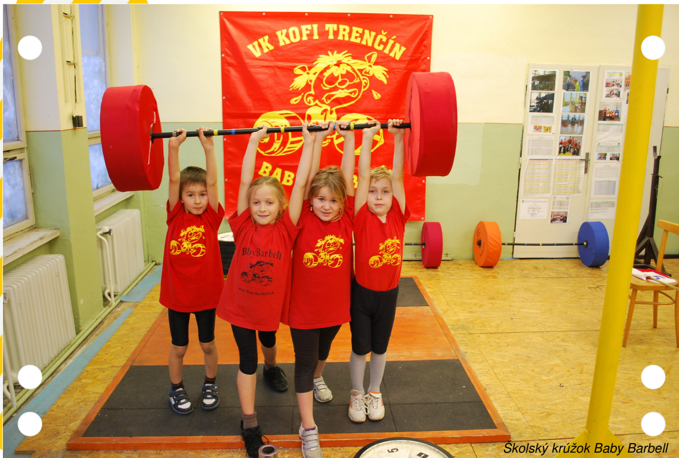
Školský krúžok Baby Barbell

T ematiku 13. a 14. vydania našej Mládeže sme poňali už trochu silvestrovo. Okrem vážnych i praktických informácií vás uvedieme na súťaže , ktoré sme usporiadali a ktorých sme sa zúčastnili na prelome novembra a decembra 2012, slávnostné udalosti , ktorých sme boli účastníkmi, vysokoškolské, školské súťaže a tréningy, ale urobíme si aj súhrn výsledkov slovenskej reprezentácie na juniorskom šampionáte Európy do 20 a 23 rokov.