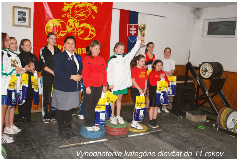
Vyhodnotenie kategórie dievčat do 11 rokov