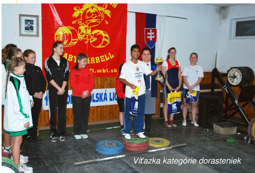
Víťazka kategórie dorasteniek

Po prijatí tohoto rozhodnutia nastal početný úbytok pri prechode do kategórie junioriek, a dievčatá, ktoré ešte zopár rokov kralovali sezónnym turnajom, sa začali z pódíí vytrácať. V lepšom prípade športovú prípravu poskytne domáci klub, ak máte šťastie.