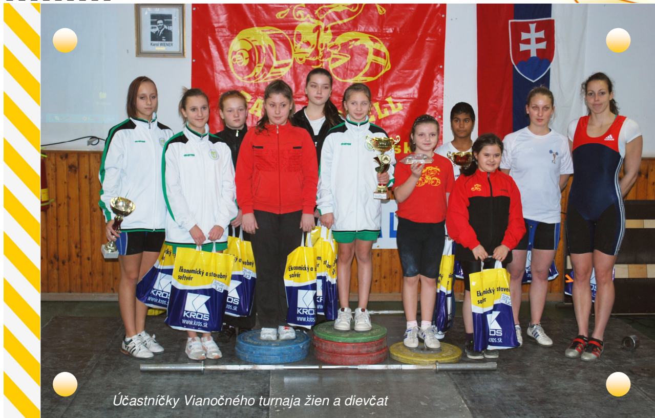
Účastníčky Vianočného turnaja žien a dievčat