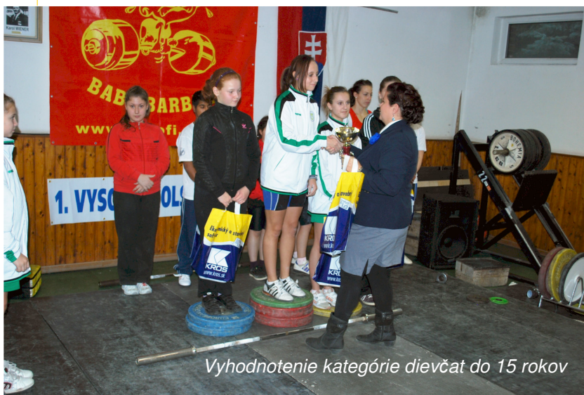
Vyhodnotenie kategórie dievčat do 15 rokov