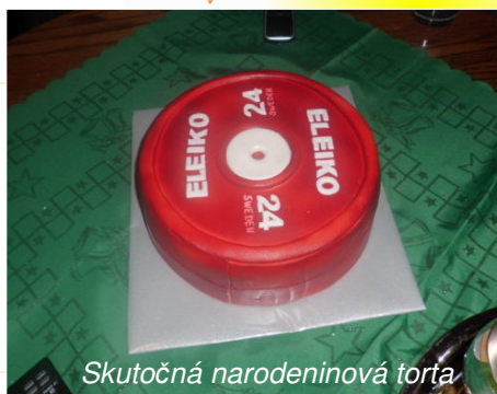
Skutočná narodeninová torta