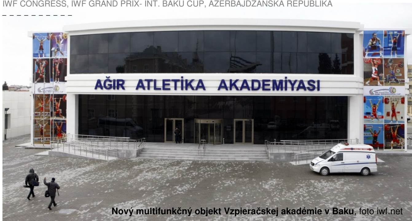
Nový multifunkčný objekt Vzpieračskej akadémie v Baku

IWF CONGRESS, IWF GRAND PRIX- INT. BAKU CUP, AZERBAJDŽANSKÁ REPUBLIKA