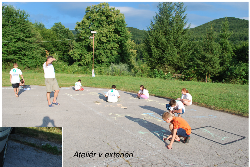
Ateliér v exteriéri

V predchádzajúcich vydaniach sme ponúkli možnosť už štvorice nahliadnutí do aktivít, konaných v rámci Letnej školy vzpierania 2012 v Trenčíne a výsledkov súťaží. V pokračovaniach si predstavíme ešte vodné aktivity, špeciálne zábavné aktivity s lanom a netradičnou chôdzou, ale aj prevetívne vyšetrenie chrbtice. Čakajú nás ešte výsledky desaťboja, aktuálny stav rekordov a porovnania uskutočnených ročníkov, dnes na našich stránkach nájdeme výtvarnú súťaž .