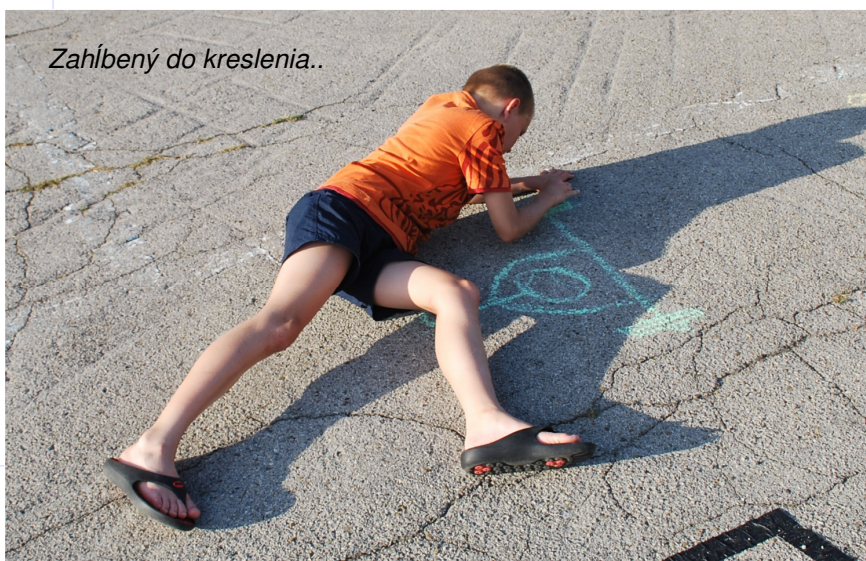
Zahĺbený do kreslenia..

Na fotografiách sledujete ukážky z priebehu výtvarnej súťaže letnej školy, priestraný areál mal počas týždňa multifunkčné využitie, parkovací, pohybový, rozcvičkový, súťažný .. aj teraz bol vyhradený hre, aj teraz s kultúrnym podtextom, ale na chvíľu sa pretvoril na skutočný umelecký ateliér.