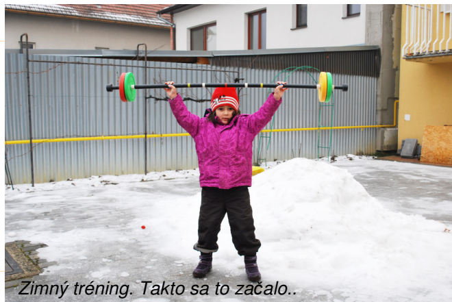
Zimný tréning. Takto sa to začalo..

Atmosféra, ktorú nezažije každý. Tradície sviatkov sa prelínajú s tradíciami športu a spájajú i oslavu narodenín, ktoré pripomína nevšedná torta. Náš oslávenec večer naporcoval to červené, takmer najťažšie spomedzi všetkých závaží, slávnostne naservírované na stole. Trenčín je mestom zázrakov. Podarí sa vám uhádnuť, či ide o fotomontáž ?