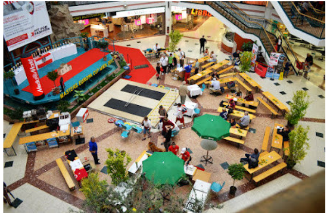
Foto – Súťaž prebiehala v obchodnom dome

Na súťaži Masters Europa Cup, ktorá sa konala 20.-21. júla 2012 v Lugner City vo Viedni štartovalo 96 pretekárov a pretekárook masters zo 14 krajín. Zo Slovenska sa zúčastnila trojica masters, ktorá vybojovala v medailovom hodnotení krajín 9. miesto s bilanciou 0-1-0.