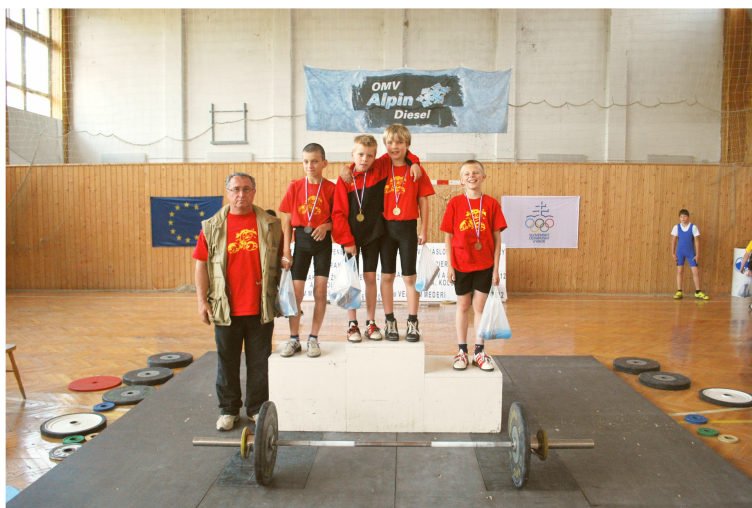
Ligové poradia družstiev pred finále Starší žiaci