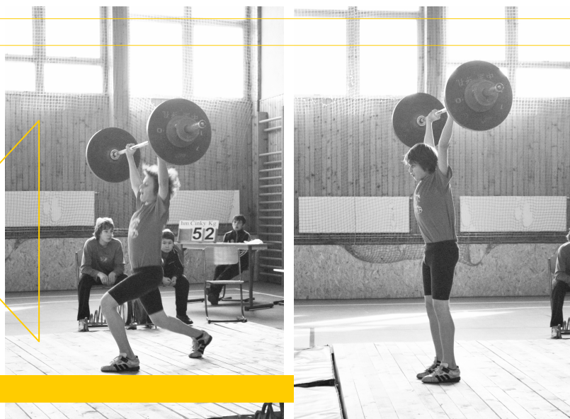
Sekvencia na str. 12 – 14 z 1. kola Žiackej ligy v Likavke