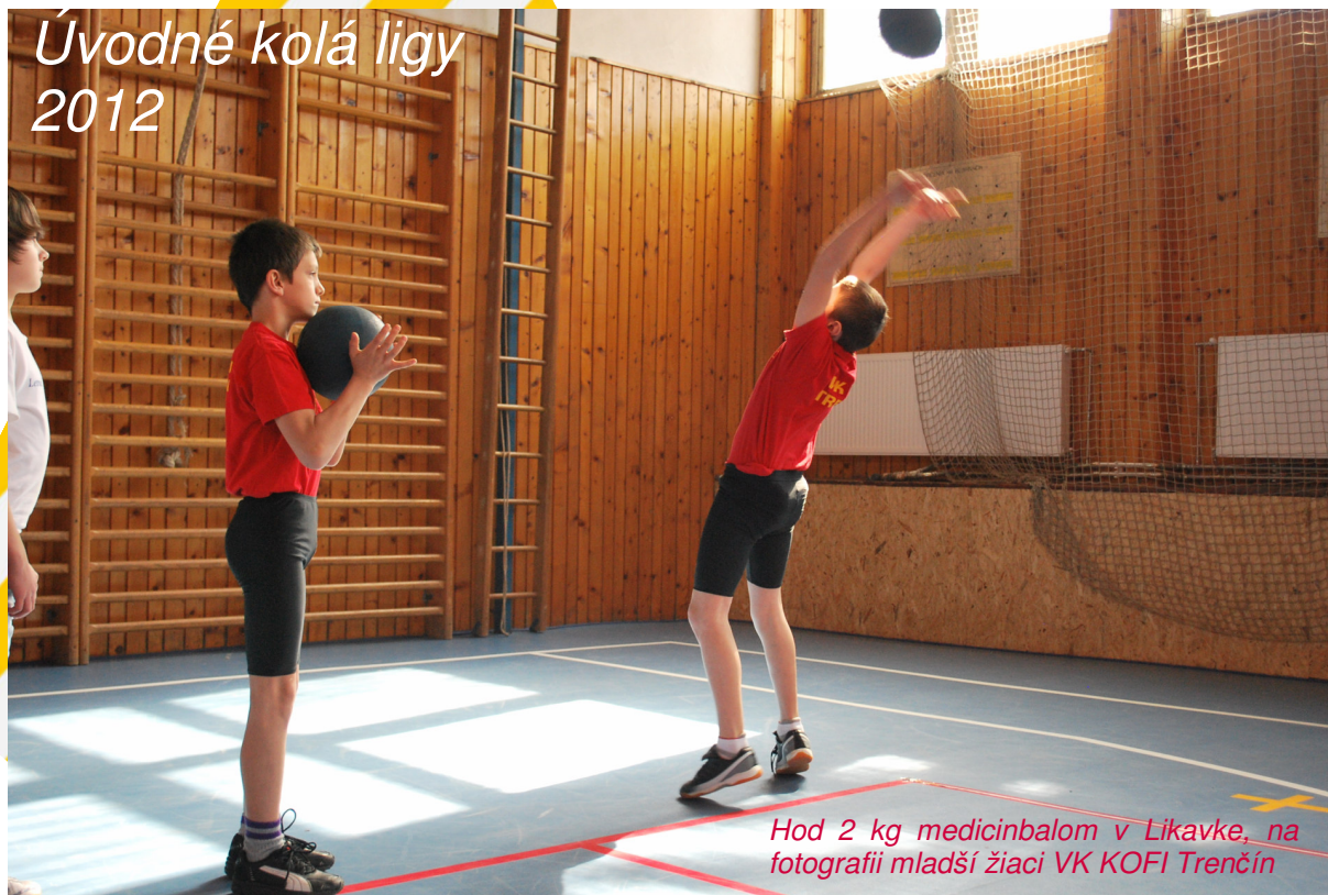
Hod 2 kg medicinbalom v Likavke, na fotografii mladší žiaci VK KOFI Trenčín