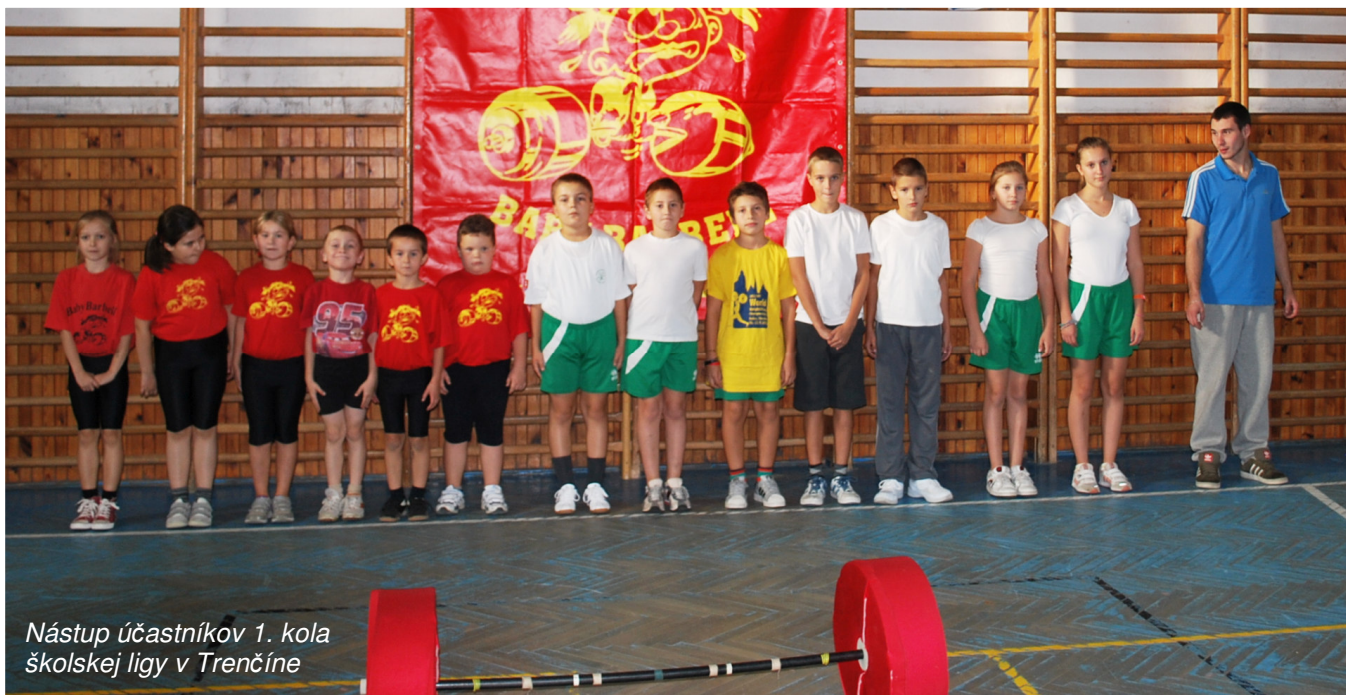
Nástup účastníkov 1. kola školskej ligy v Trenčíne